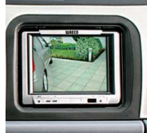
Geri Görüş Sistemi (Renkli LCD Ekranlı)