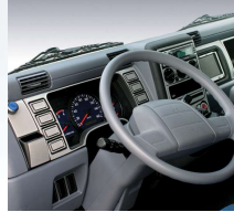
Ön Panel Kaplama (Alüminyum Görünümlü)