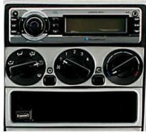
MP3 Çalar (Flash Disk Girişli)