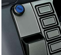
Telefon Kiti (Bluetooth)