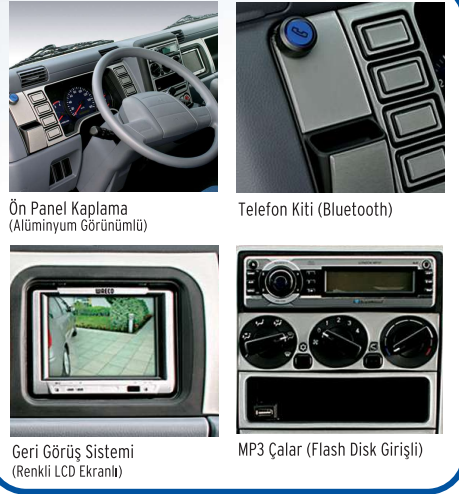
Ön Panel Kaplama (Alüminyum Görünümlü)