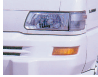
Projektör tipi, görüşü artıran halojen farlar