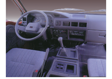
Ergonomik ön konsol ve gösterge paneli