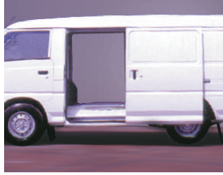
Çift yan sürgülü kapılar