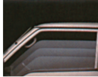
Elektrikli ön camlar ve merkezi kilit