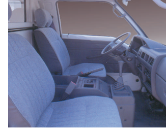
Konforlu ve geniş sürücü kabini