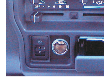
Far yükseklik ayarı ve klima (Deluxe modellerde standart)