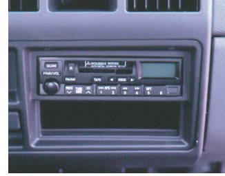
Elektronik aramalı AM/FM radyo-kasetçalar ve çift hoparlör