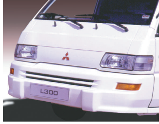
Gövde rengi, yeni dizayn tampon